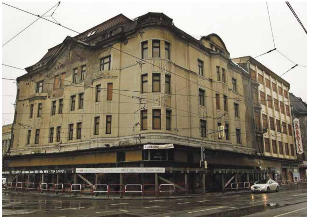
Zchátralý komplex Ostravica Textilia

Propojení kultury, umění, architektury a urbanismu předpokládá citlivý a zodpovědný přístup k historickému centru Ostravy. Proto je naprosto nezbytné zapojit do jeho utváření jeho obyvatele, odborníky, zájmové spolky a iniciativy. Nejdůležitější je ovšem politická vůle veřejný prostor rozvíjet tak, aby splňoval nároky na funkčnost i estetiku. Dosud jsme svědky spíše dílčích pokusů než ucelené koncepce oživení veřejného prostoru. Ostrava jako město, kde před více než 100 lety působil slavný rakouský architekt a urbanista Camillo Sitte navrhuující smysluplně koncipovaný veřejný prostor, by měla mít ambice na tento odkaz